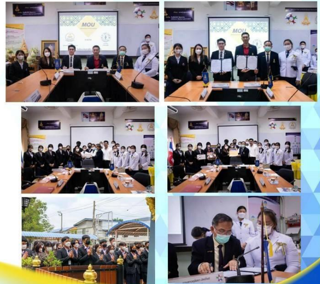
โรงเรียนนวมินทราชูทิศ กรุงเทพมหานคร 115 ซ.นวมินทร์ 163 แขวงนวลจันทร์ เขตบึงกุ่ม กรุงเทพมหานคร 10230