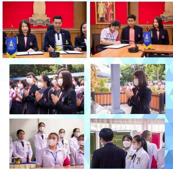
โรงเรียนนวมินทราชูทิศ กรุงเทพมหานคร 115 ซ.นวมินทร์ 163 แขวงนวลจันทร์ เขตบึงกุ่ม กรุงเทพมหานคร 10230